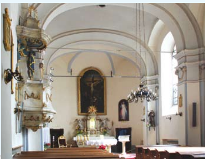
Wnętrze kościoła, 2008 r.

Ulicą Szersznika kierujemy się w stronę Rynku. Przecinając główny plac miasta wchodzimy w ul. Głęboką, by z lewej strony, na małym Placu św. Krzyża, znaleźć wejście główne do obecnego kościoła parafialnego. (cd. w kolejnych WR)