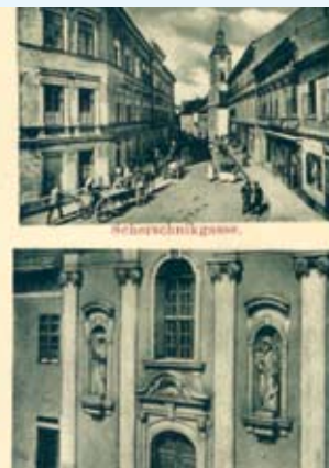
Pocztówka z 1905 r.

Zapraszamy Czytelników do współredagowania tej strony. Prosimy o nadsyłanie ciekawostek związanych z Cieszynem (np. anegdot, przepisów kulinarnych, zdjęć, dokumentów, wzorów rękodzieła artystycznego itp.), które mogłyby zainteresować innych i wzbogacić wiedzę o naszym mieście. Gwarantujemy zwrot wszystkich otrzymanych materiałów. Wiadomości Ratuszowe, Biuro Promocji i Informacji, Rynek 1, 43-400 Cieszyn, wr@um.cieszyn.pl