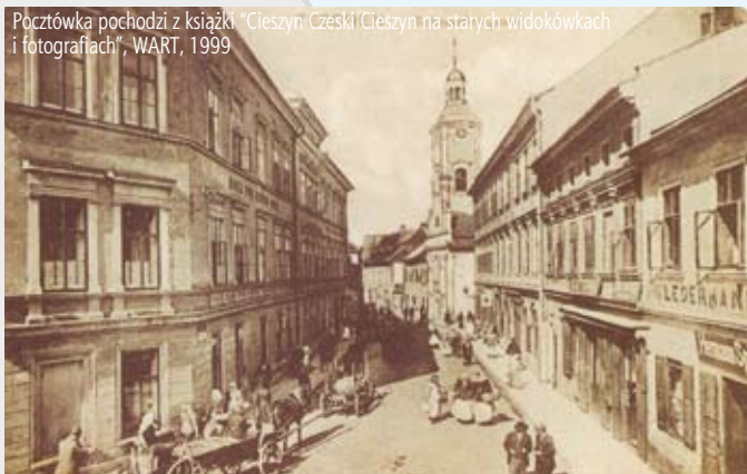
Ulica Jezuicka, pocztówka z 1909 r.

Pocztówka pochodzi z książki "Cieszyn Czeski/Cieszyn na starych widokówkach i fotografiach", WART, 1999