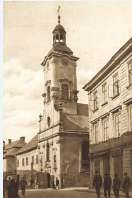
Widok na kościół, ok. 1914 r.

W 1794 r. powstał nowy ołtarz główny ze scenami Ukrzyżowania i Ostatniej Wieczery, według projektu A. K. Schweigla, potem dwa boczne ołtarze. W 1862 r. przebudowano wieżę, a w końcu XIX w. fasadę, umieszczając na osi kamienny portal, a w dwóch niszach rzeźby św. Ignacego Loyoli i św. Józefa.