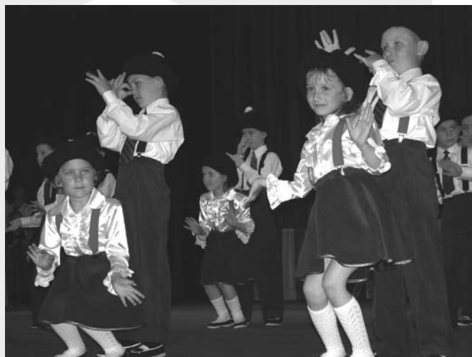
Występy przedszkolaków w cieszyńskim teatrze

Oczywiście tak. Takie przedsięwzięcie wprowadza i wykonawców, i widzów w świat teatru – prób, sceny, oklasków... Tego typu przedsięwzięcia kształtują u dzieci również pewien smak estetyczny – zwracają