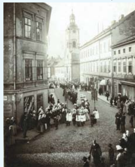
Ulica Jezuicka (obecnie Szersznika), początek XX w.

Tekst pochodzi z ulotki pn. „VIA SACRA. Kościoły i klasztory w Cieszynie i Czeskim Cieszynie” wydanej przez Biuro Promocji i Informacji UM. Można ją otrzymać w Cieszyńskim Centrum Informacji (Ratusz, parter).